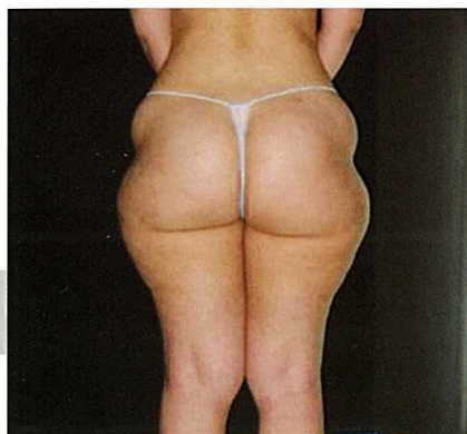
Fig. 3: miniliposuzione laser-assistita con cannule da 2mm. 4 sedute: regioni iliache e trocanteriche. Roll'Up e Roll'Out tra le sedute e nel post-operatorio

Questo protocollo chirurgico minimamente invasivo, eseguibile in tutte le sue fasi in regime ambulatoriale, in anestesia locale pura, con un paziente vigile e collaborante in grado di riprendere le normali occupazioni già il giorno dopo l'intervento, oltre a dare "quantitativamente" risultati paragonabili a una normale liposuzione e "qualitativamente" certamente superiori, ci permette di operare nel modo che più amiamo. Infatti, ritornando alla nostra immagine iniziale possiamo dire che più la chirurgia estetica diventa minimamente invasiva – e lo diventa, nel nostro caso, grazie anche all'uso "ragionato" del nuovo Cellu M6 Endermolab – più è bella da vedere, perché finalmente si placa nel chirurgo la foga del combattente ed emerge se non proprio l'artista, quanto meno il sarto. ■