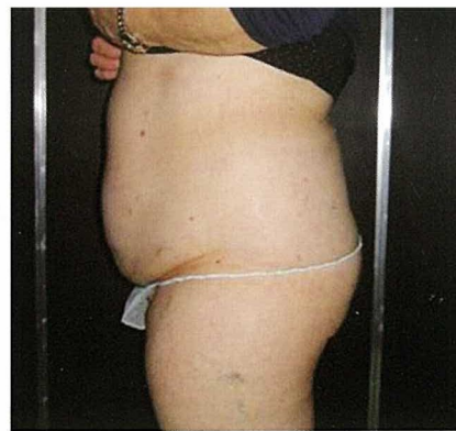
Fig. 2: Egodrive Roll in pre operatorio. Miniliposuzione laser-assistita con cannule da 2,5mm. 2 sedute: Addome superiore e inferiore. Roll-Up e Roll-Out tra le sedute e nel post-operatorio

nule di 2-2,5 millimetri di diametro e trattiamo il grasso sotto-dermico con una laser-cannula di 1 millimetro di diametro. Otteniamo così una riduzione volumetrica dovuta essenzialmente alla mini-liposuzione e una notevole retrazione cutanea grazie al laser. Alla fine dell'intervento la paziente indossa un indumento elastocompressivo, sta in osservazione per due ore circa e quindi viene dimessa dall'ambulatorio con un foglio di istruzioni, numeri di telefono di pronta reperibilità e la profilassi antibiotica.